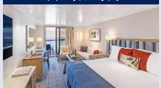
約31㎡ ベランダ・シャワー付