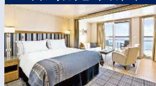
約38㎡ ベランダ・シャワー付