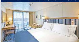
約25㎡ ベランダ・シャワー付